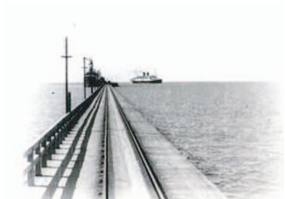
Muelle de Puerto Colombia.