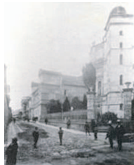
Teatro Municipal de Bogotá (al fondo).