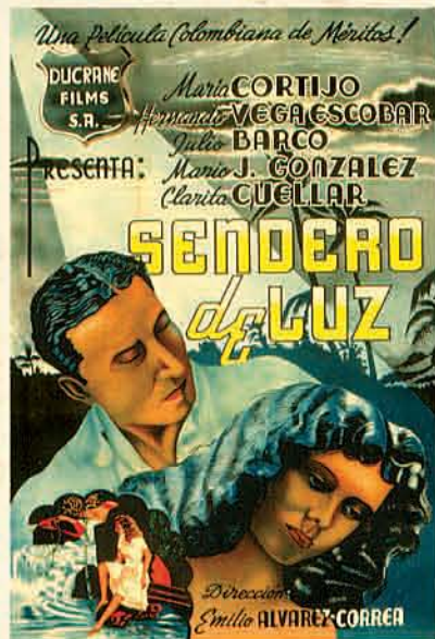
Cartel Sendero de luz, 1945