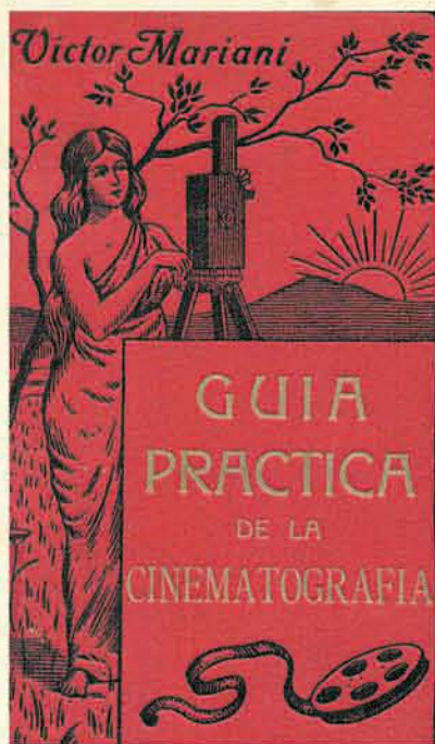
Guía práctica de la cinematografía, 1915