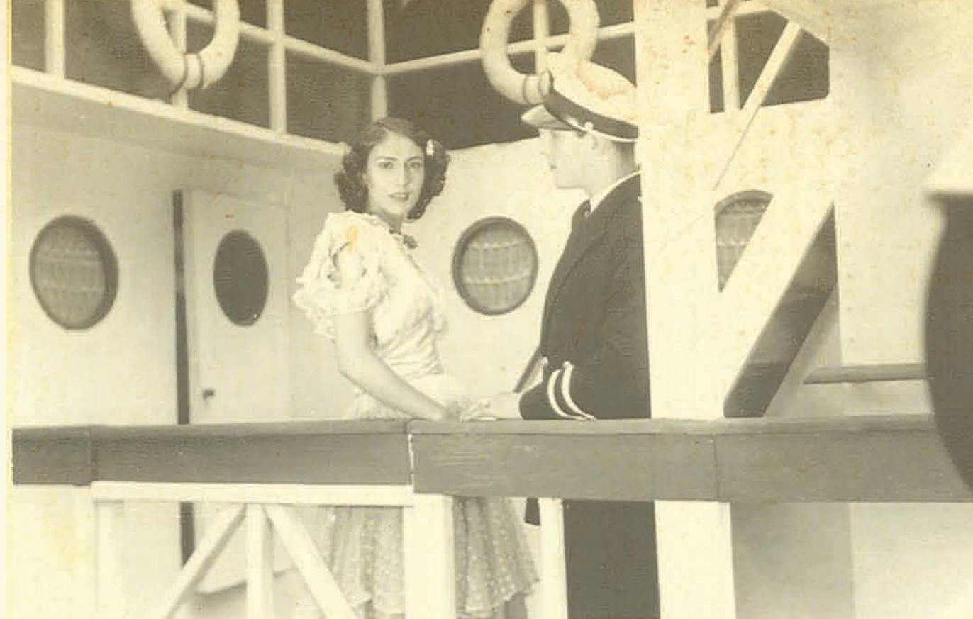
Allá en el trapiche 1943