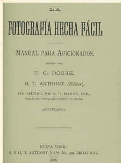
La fotografía hecha fácil, 1886