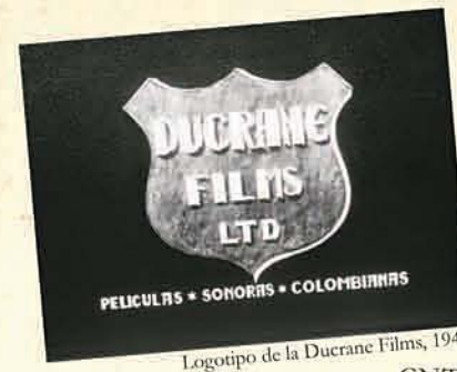
Logotipo de la Ducrane Films, 1943

Se custodian igualmente fondos audiovisuales de Secretaría de Prensa de la Presidencia de la República, Ministerio de Cultura, Proimagenes Colombia, Caracol TV, INRAVISION, Compañía de Informaciones Audiovisuales, Comisión Nacional de Televisión CNTV, Instituto Colombiano de Antropología e Historia, Fundación Luis Carlos Galán Sarmiento, Fundación Hogares Juveniles Campesinos, AVIANCA, Corporación Nacional de Turismo, Colseguros, Instituto de Fomento Industrial, Caracol, y los de entidades afines del ámbito regional como la Fundación Cinemateca del Caribe, Fundación Caucana del Patrimonio Intelectual, Cinemateca Distrital de Bogotá, Archivo Fílmico y Fotográfico del Valle del Cauca y las colecciones de productores y realizadores independientes.