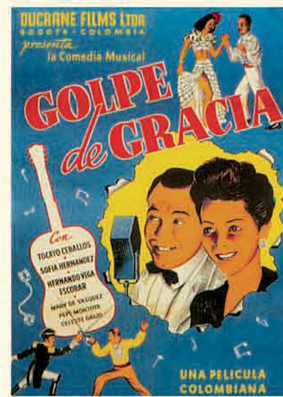
Cartel de Golpe de gracia, 1944.