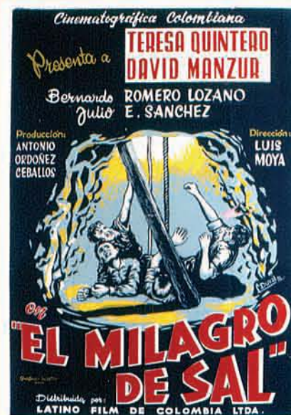
Cartel de El milagro de sal, 1958.

La Fundación ha tenido como propósito principal el acopio y la valoración de los registros de imágenes en movimiento de producción nacional. Entre otros se destacan acervos audiovisuales provenientes de: Di Domenico Hermanos y Sociedad Industrial Cinematográfica Latinoamericana -SICLA- (1909-1927), El Archivo Histórico Cinematográfico de los Acevedo (1915-1958), Calvo Films (1922-1946), Ducrane Films (1938-1946), PROCINAL (1947-1955), Cinematográfica Colombiana (1950-1958), Grancolombia Films (1947-1980), Panamerican Films (1956-1978), Bolivariana Films (1969-1978), Producciones Cinematográficas Uno (1970-2006), Euramerica Films (1973-1984), Producciones Casablanca (1980-2006), Compañía de Fomento Cinematográfico FOCINE (1978-1992), Tucán Producciones Cinematográficas LTDA. (1984-2004), CMO Producciones (1995).