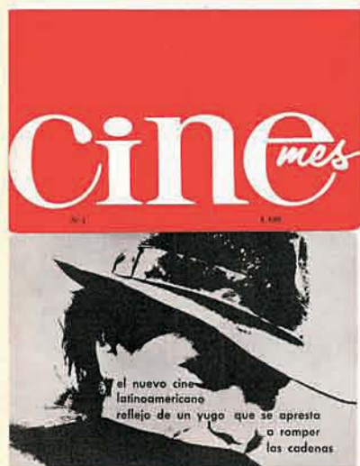
Revista: Cine mes, 1965