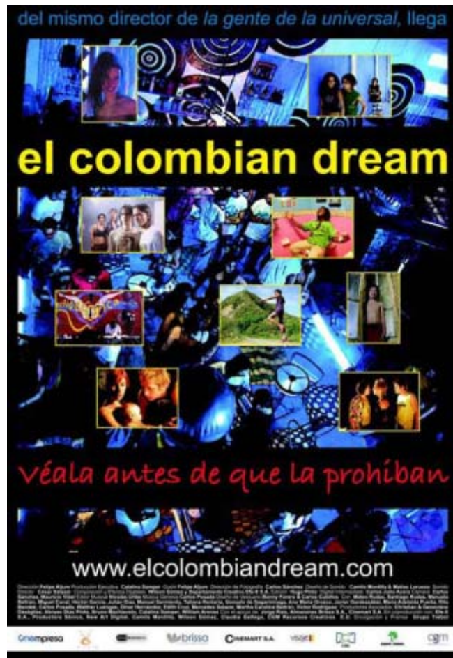
Cartel "El colombiano dream" 2006

SINOPSIS: unos jóvenes gemelos se encuentran de vacaciones en un balneario cercano a Bogotá y, en su afán de conseguir dinero fácil, venden pastillas alucinógenas entre los clientes de 'El colombiano dream', el bar de su familia. Uno de sus proveedores les da a guardar una gran cantidad de «mercancía» que ha robado a sus socios, pero muere producto de una sobredosis después de la entrega. Los traficantes empiezan a buscar desesperadamente sus pastillas, involucrando a los gemelos, su familia y amigos en una desenfrenada persecución.