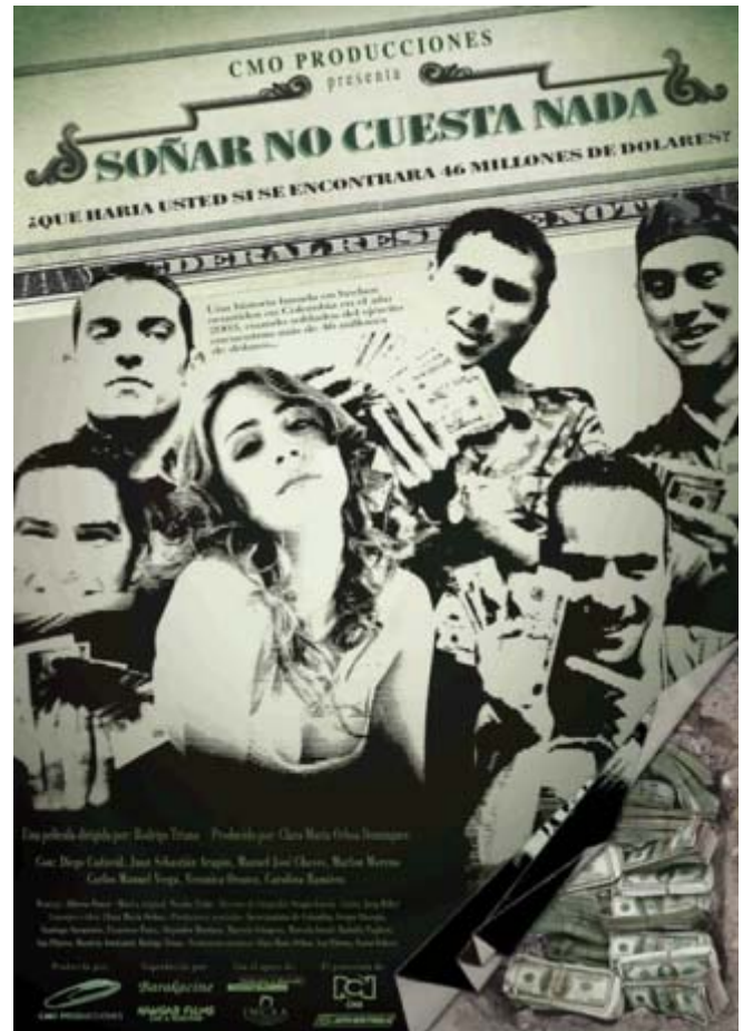
Cartel "Soñar no cuesta nada" 2006

SINOPSIS: la historia, basada en hechos reales ocurridos en Colombia en mayo del 2003, narra los sueños y aventuras de Porras, Venegas, Lloreda y Perlaza, cuatro de los soldados que conforman el batallón de la compañía contraguerrilla «Destroyer». Ellos descubren una caleta enterrada con más de 46 millones de dólares de las FARC, pero pierden el control cuando se dan cuenta de que están totalmente aislados pues el puente, único medio de comunicación con la civilización, acaba de ser dinamitado; todo es irónico casi surrealista, los soldados no tienen comida, ni agua, ni papel higiénico pero duermen encima de sus morrales repletos de dólares. Su gran reto: llegar a la civilización y hacer realidad sus sueños.