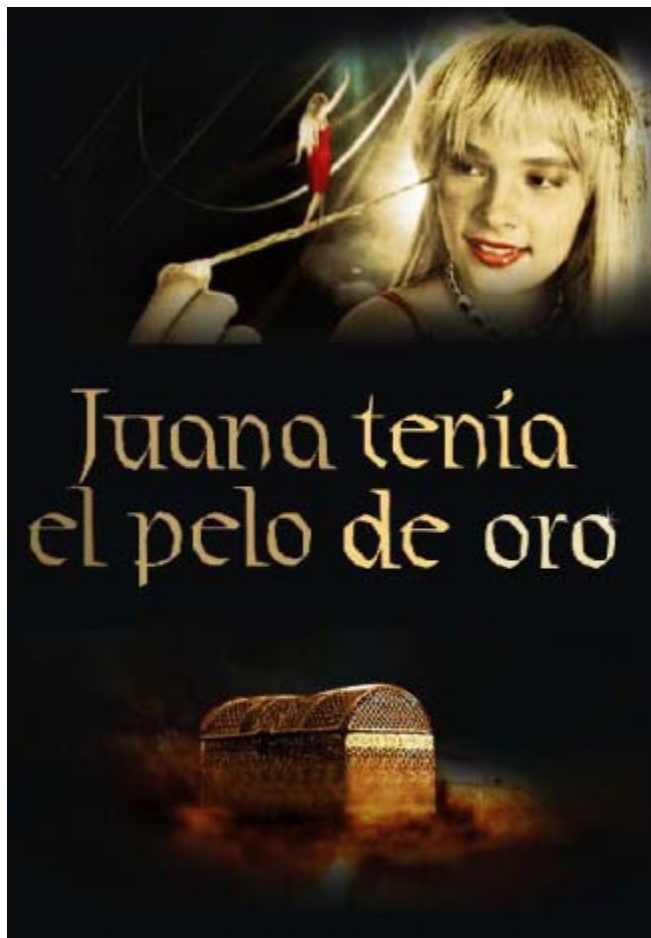
Cartel "Juana tenía el pelo de oro" 2006

SINOPSIS: un mago revela la existencia de Juana, una niña que vive en Ciénaga y tiene el pelo de oro. Un periodista, que por casualidad ha asistido a la función, empieza la búsqueda de Juana hasta que la descubre y publica la noticia, desencadenando las ambiciones de los poderosos del pueblo. La puja la gana el Obispo quien, con Biblia en mano, pontifica que sus cabellos son un bien divino y que, por seguridad, la niña debe quedarse a vivir en la parroquia. Allí obligan a Juana a realizar oficios domésticos y le cortan el pelo para bordar con ellos las vestimentas litúrgicas. Alertada por el monaguillo, Juana se rebela y decide utilizar su poder femenino ante el Obispo.