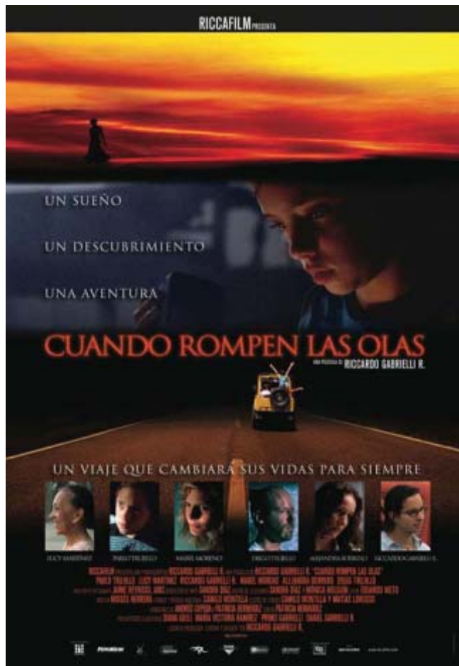
Cartel "Cuando rompen las olas" 2006

SINOPSIS: Daniel, un niño generoso y curioso, encuentra en el ático un polvoriento álbum con fotografías antiguas. La última página contiene una vieja invitación dirigida a su abuela Sofía, para el «Baile de la Rosa». El día del cumpleaños de Sofía en su ancianato, al soplar las velas, cierra sus ojos pidiendo el mismo deseo que ha pedido durante muchos años: asistir al «Baile de la Rosa». Daniel decide complacerla.