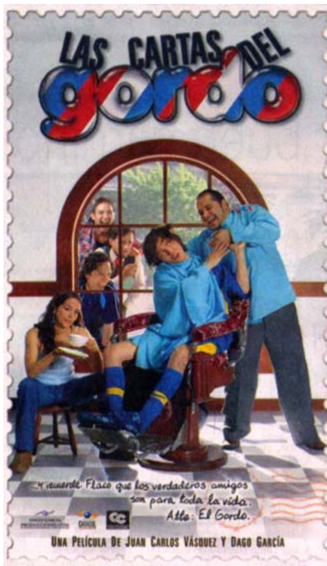
Cartel "Las cartas del gordo" 2006

SINOPSIS: el gordo Carlos Julio Martínez es un barbero y su amigo de infancia, el flaco Alfredo Rangel, es un futbolista con una prometedora carrera, que lo lleva a formar parte de un equipo de primera división en Argentina. Así, con el tiempo el gordo ha dedicado a crear en su barbería un altar de los triunfos de su amigo, a pesar de los comentarios malintencionados y la envidia de los otros amigos del barrio. Pero una desafortunada lesión hace que el flaco termine intempestivamente su carrera deportiva y regrese al barrio, solo y frustrado. La única mano en que se puede apoyar es la del Gordo, su leal amigo, quien le ofrece su casa y lo ayuda a salir de la crisis.