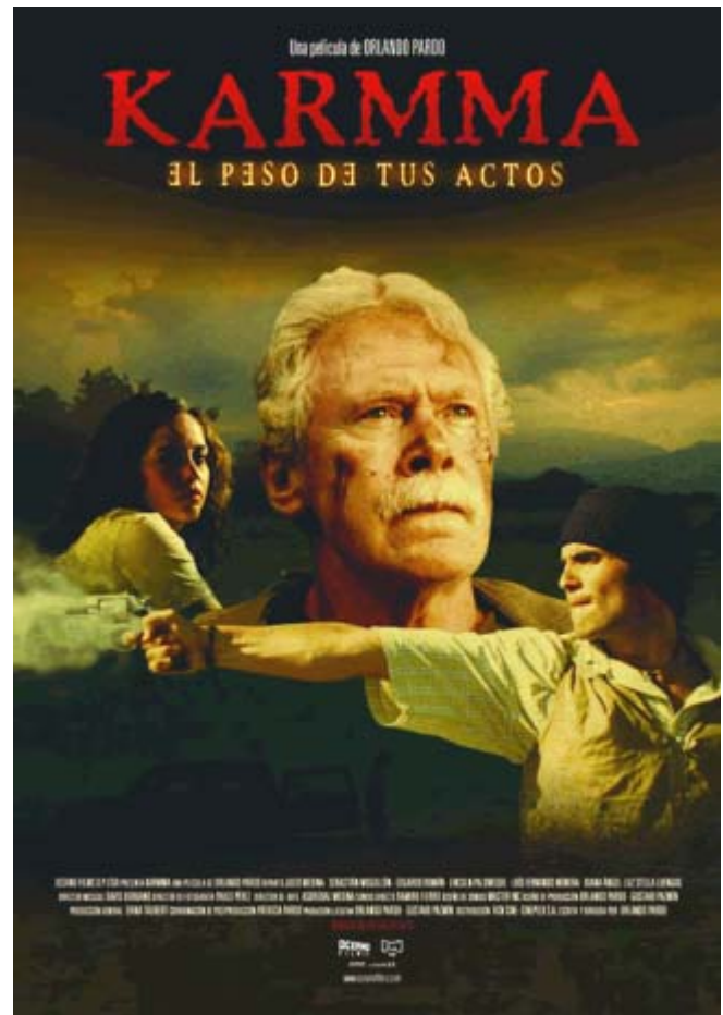
Cartel "Karmma, el peso de tus actos" 2006

SINOPSIS: ¿qué sucedería si un secuestrador descubre que acaba de plagiar a su propio padre? En medio de la belleza y el misterio de los Llanos Orientales, Guaco, el capataz de la hacienda 'La Diana', es testigo de cómo la vida y la familia de su patrón se destruyen y se manchan de sangre.